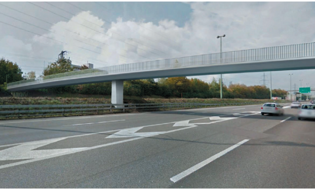
Die künftige neue Personenüberführung Oberwies mit einer Pfeilerabstützung im Mittelstreifen (Visualisierung).

Ab Dienstag, 6. April, bis voraussichtlich Ende Oktober 2021 ersetzt das Bundesamt für Strassen ASTRA die Personenüberführung Oberwies. Während dieser Zeit ist die Verbindung für jegliche Nutzung gesperrt. Eine Umleitung über die Neue Winterthurerstrasse wird signalisiert.