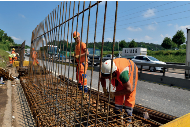
Erstellung der Leitmauer, Fahrtrichtung Zürich.