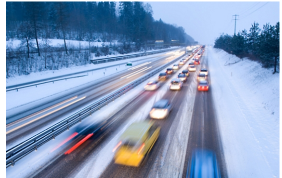
Strassen in Betrieb

Das Erkennen von Sicherheitsrisiken vor Baubeginn ermöglicht sicherheitsrelevante Planungsanpassungen zu minimalen Kosten.