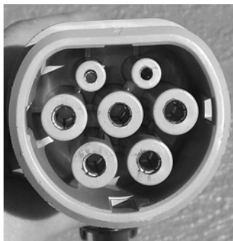
Typ 2 Mode 3 (Wechselstromladung)

Alle relevanten Standards (Systeme und Steckertypen) müssen am Standort angeboten werden. Aktuell sind dies folgende drei Systeme, die aus der IEC-Normenreihe 62196 abgeleitet sind: