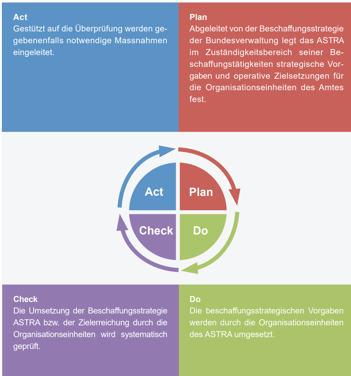
Abbildung: PDCA-Verbesserungszyklus nach ISO 9001

Bei Bedarf wird diese Beschaffungsstrategie überprüft und aktualisiert. Daneben wird diese in Abstimmung mit der Beschaffungsstrategie der Bundesverwaltung Ende 2025 im Rahmen eines Strategiereviews überprüft. Ab 2025 wird die Überprüfung der Strategie in einem fünf Jahres Rhythmus erfolgen. Die Festlegung von Zielen und Massnahmen zur Umsetzung der Beschaffungsstrategie ASTRA erfolgt im Rahmen der bestehenden Managementprozesse des Amtes.